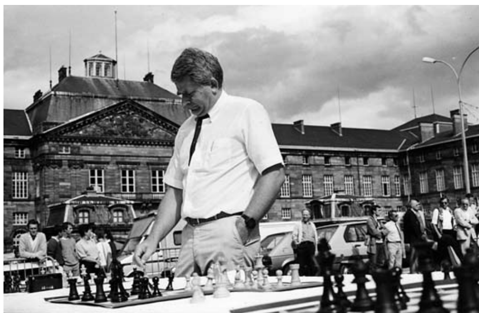
Boris Spassky à Saverne en 1987.

N'oublions pas notre partenariat privilégié avec le cercle d'échecs de Schott Mainz, qui se traduit par des échanges réguliers de joueurs. Deux week-ends sont aussi organisés chaque année, dans un refuge vosgien, afin d'établir de meilleurs contacts entre les joueurs.