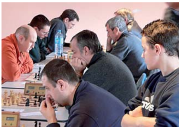
Saverne II en pleine compétition.