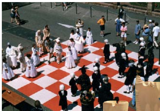
Echiquier vivant (1998).